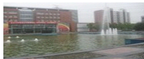
河水补充河水景观喷水池